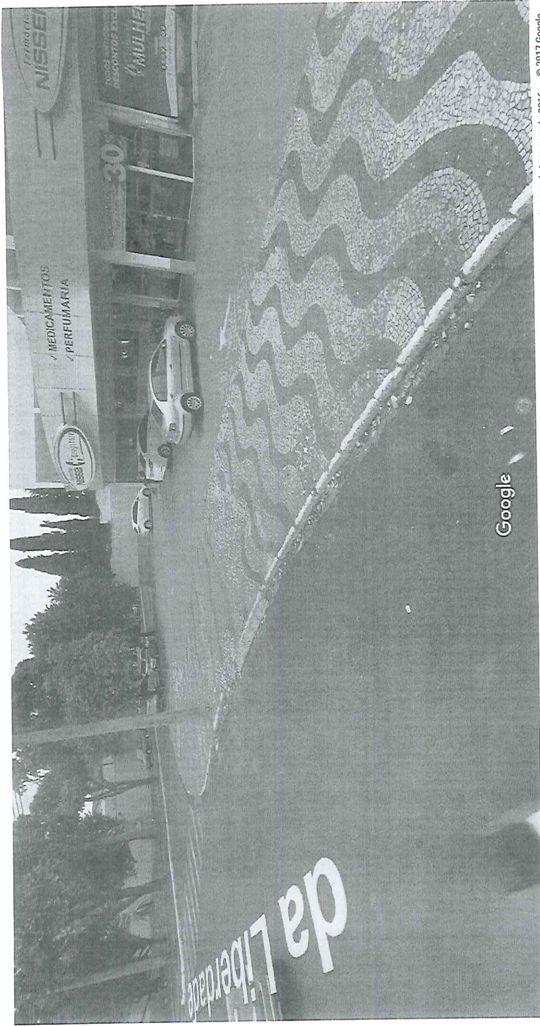
Captura da imagem: abr 2016 © 2017 Google