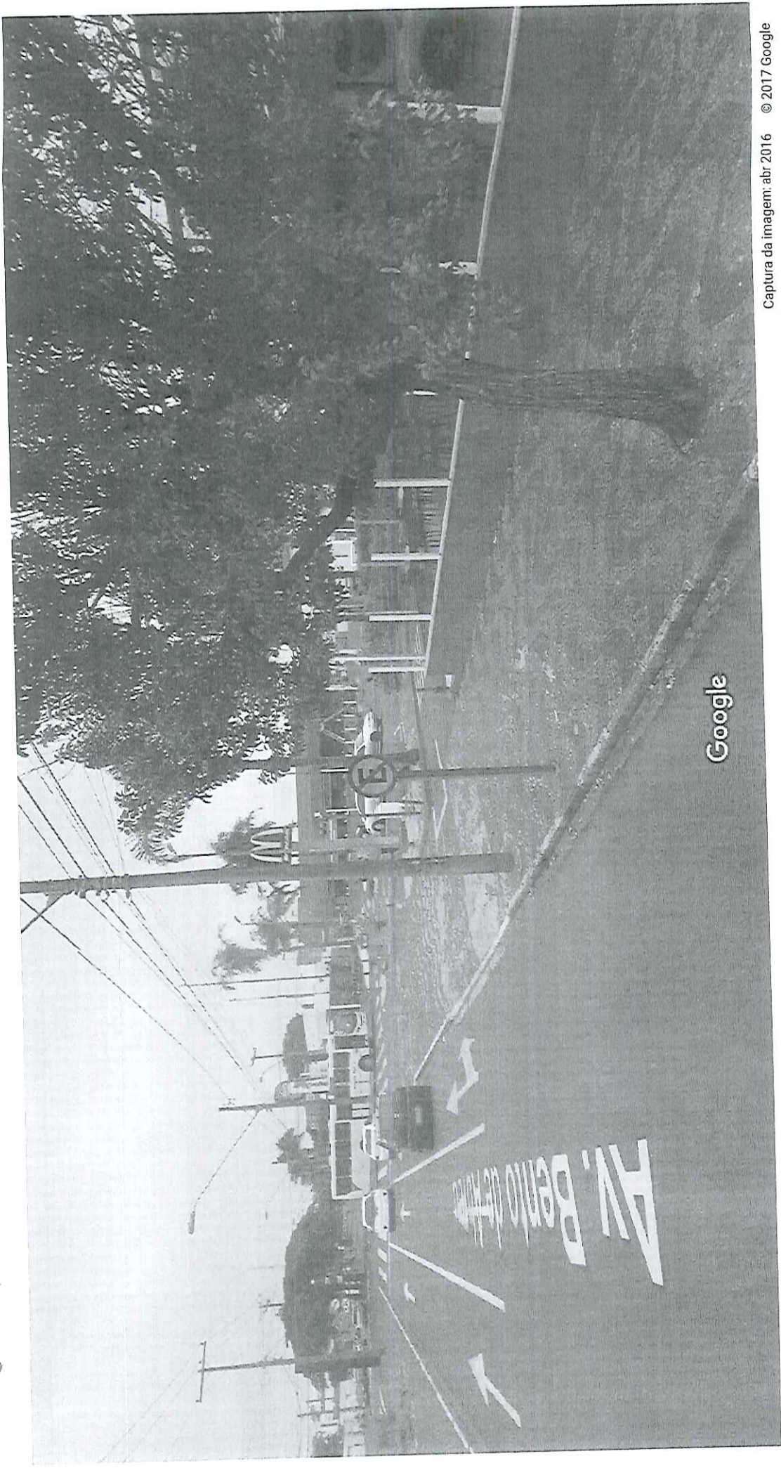
Captura da imagem: abr 2016 © 2017 Google

Araraquara, São Paulo Street View - abr 2016