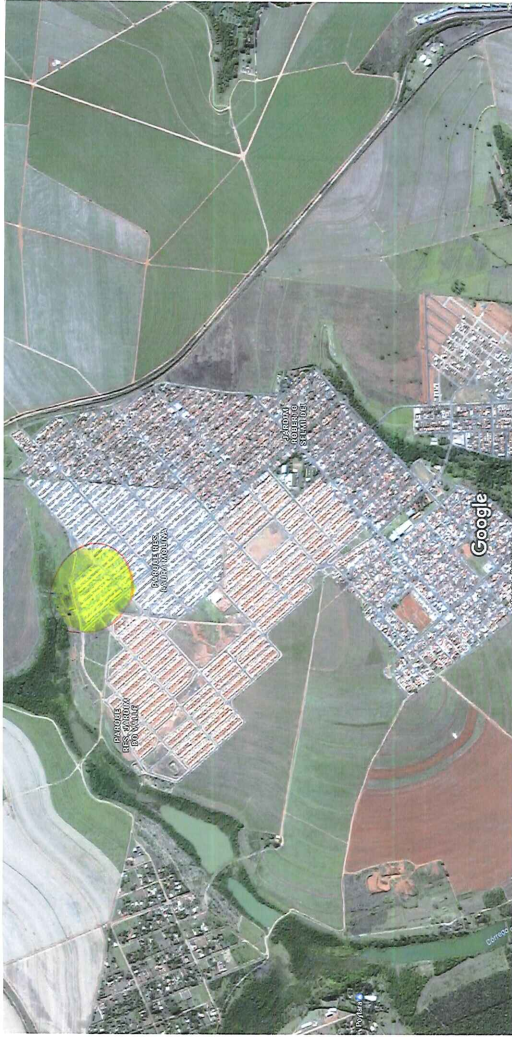
Imagens ©2017 DigitalGlobe,Dados do mapa ©2017 Google 200 m