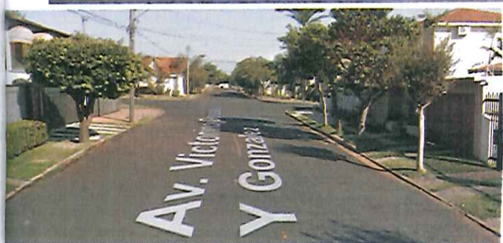
Avenida Victorino Gonzalez Y Gonzalez com belas casas